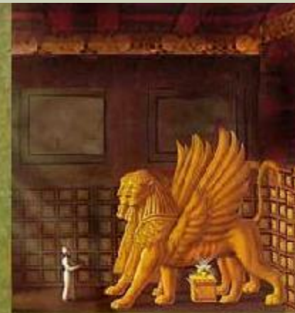
Holy of Holies